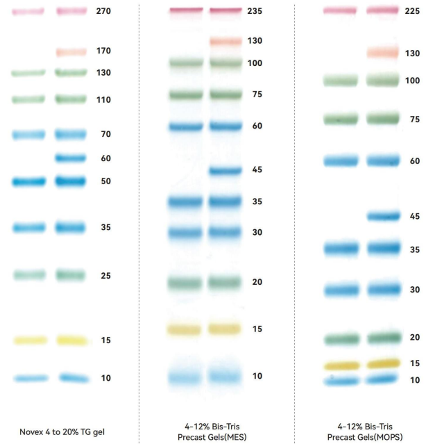
图 2 PM0409/PM0511 在不同电泳缓冲条件下, 各条带指示分子量